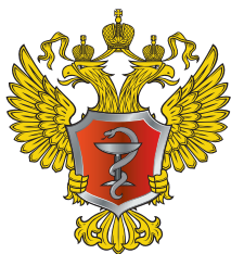
Министерство здравоохранения РФ

Не растерявшись в экстренной ситуации и правильно оказав первую помощь, вы спасете ребенку жизнь!