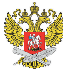
Министерство просвещения РФ